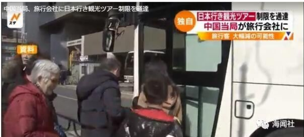
TBS电视台有关报道的视频截图